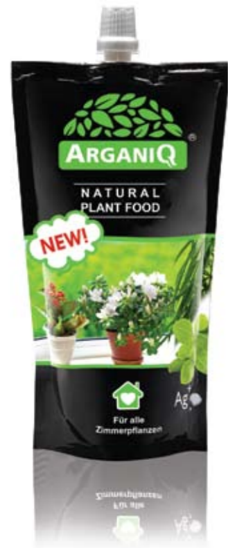
Natural plant food 0,5 kg

VPE 30 Palette 960 (32x30) EAN code 4670001890014