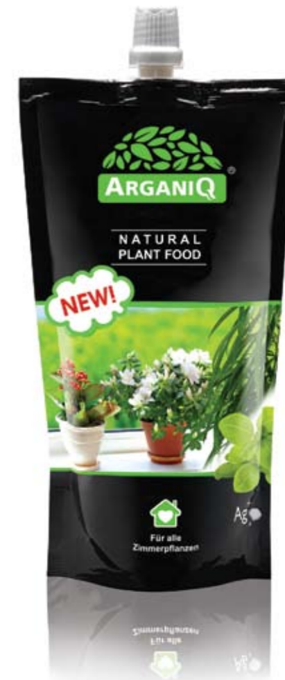
Natural plant food 1 kg

Quand il sera temps de transplanter la plante, ajoutez de l' AgraniQ à ses racines. Pressez une seule fois sur le récipient, et la plante vous réjouira par son aspect sain et fleurissant. C'est simple à faire comme un-deux-trois, et le résultat est toujours stable