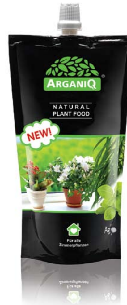
Natural plant food 1 kg

Quand il sera temps de transplanter la plante, ajoutez de l' AgraniQ à ses racines. Pressez une seule fois sur le récipient, et la plante vous réjouira par son aspect sain et fleurissant. C'est simple à faire comme un-deux-trois, et le résultat est toujours stable